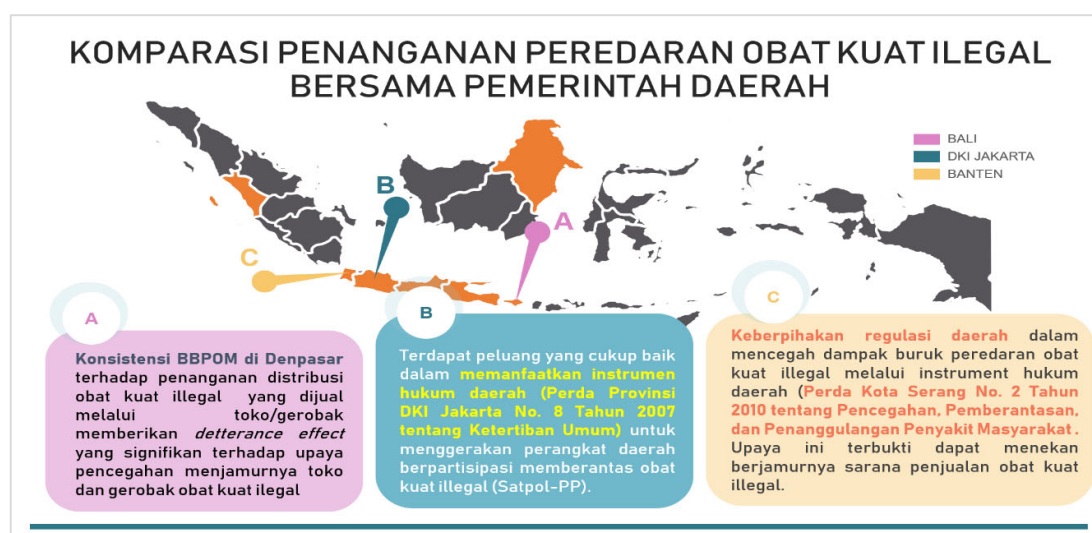
Gambar 1. Komparasi Penanganan Peredaran Obat Disfungsi Ereksi Ilegal

Pada delapan wilayah pengumpulan data, terdapat beberapa wilayah yang dapat dijadikan sebagai studi komparasi lebih lanjut dalam upaya pemberantasan obat disfungsi ereksi ilegal pada wilayah tersebut. Beberapa upaya tersebut dapat mencerminkan keberhasilan dalam memberantas obat disfungsi ereksi ilegal, menggerakkan partisipasi pemerintah daerah dan penegakan peraturan daerah (Gambar 1).